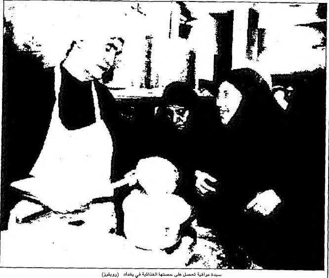
سيدة عراقية تحمل على حمتها الطفلة في بغداد (مؤرخ)

مدقق النفس العربي، من داود المولى... تركيا تقرب من معور عراقي اردني وايران تتحالف مع جمهوريات آسيا